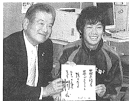
やったあ! Jリーグめざすぞ

堺トレセンは臨海部の33 号 に天然芝、人工芝のピッチが15面、フットサルコートも8面備える国内最大級の施設。川淵キャプテンが「海外から利用申し込みの殺到が予想され、日本のみならずアジアサッカーの発展に貢献できる」と言われるように、堺中蹴球部創設以来90年、私たちの育った堺市が、サッカーで世界から注目される都市になるのです。