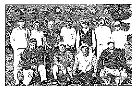
(サッカー部幹事:高22/畑)

なお、サッカー部OB会のコンペは06年の開催は見送り、07年春開催で改めて企画しますのでご了解をお願いします。