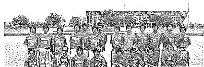
WABUCHI-CUP 三国丘高 vs 泉陽

今年の川淵杯泉陽高定期戦は、7月23日に金岡公園競技場で行いました。まず現役は、前後半を通じて泉陽を圧倒し2-1で昨年に続いての勝利となりました。川淵杯は三国丘が獲得。通算成績は三国丘の4勝9敗。