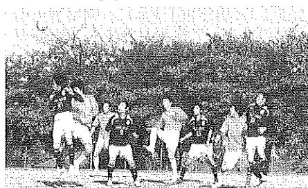
▲9月13日 対ヤングタウン戦

昨年リーグ3部Bを優勝で終え、今期から我が三国丘サッカークラブは2部Aへと昇格しました。今期の最初の大会は堺種目別トーナメントで、3回戦まで進みましたが、1部の府大サッカー同好会に1-3で敗退しました。今季はベスト4を狙っていただけに悔しい限りです。今期でリーグ登録3年目になり年代を超えてチームのまとまりが見えてきました。練習量はいまだ少ないですが、各自トレーニングをしたりしてその分を補っています。10月には現役とも練習試合をこなしOBとして、しっかり相手を出来るチームになってきたと思います。今季も優勝そして一部昇格を目指し残り試合もチーム一同頑張ります。