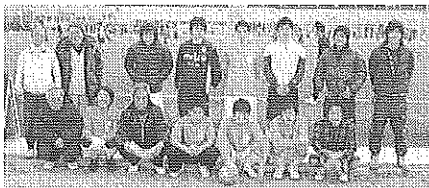
▲2月20日 対フェニックス戦