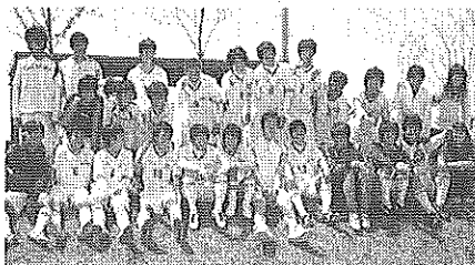
▲対阿倍野高戦後の選手運