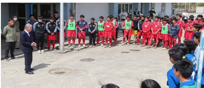
写真左：泉北高校にて皆さん、いい顔しています。(泉北高校選手たちとも集合写真を撮影していただきました)