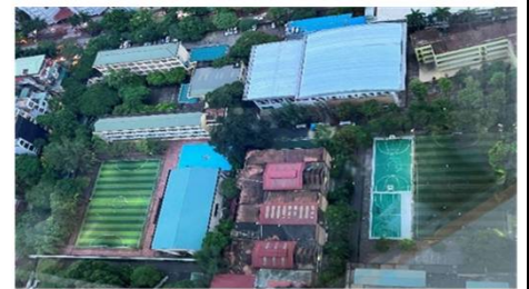
写真: 首都ハノイでホテルの部屋から撮影。 近接する2つの高校がそれぞれフットサルコートを持っています。