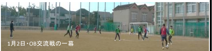
1月2日・OB交流戦の一幕